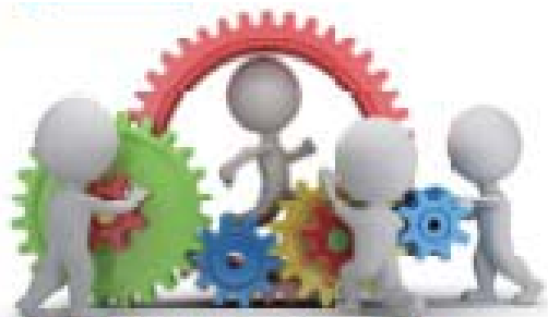
Karakuri KAIZEN Exhibition 2017