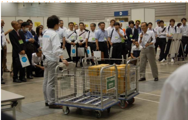
2016年コンテスト風景

展示作品のなかから、ご応募いただいた台車作品で、「手押し台車コンテスト」を実施します 台車作品は各社様での汎用性が高く、参考になるということで たいへんご好評をいただいております イベント会場にて、ステキな作品をご覧ください!!