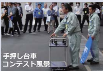
手押し台車コンテスト風景

「手押し台車」はダイバーシティ・重筋作業の軽減・現場の安全確保などの観点から、製造現場のみならずあらゆる場面で汎用性が高く、参加者から注目されています。そこで「手押し台車」をクローズアップし、コンテスト形式で審査・表彰を行います。今年コンテストに16作品がエントリーしています。